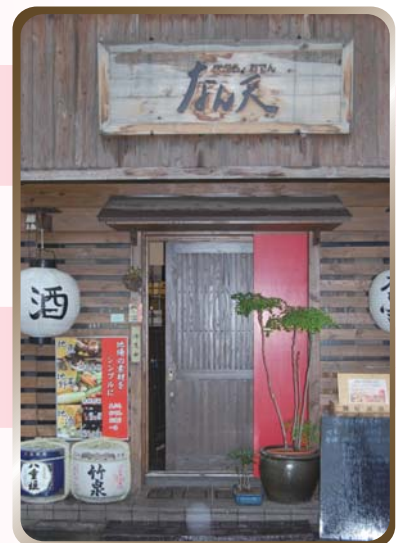
第3回ゲストのお店 なん天