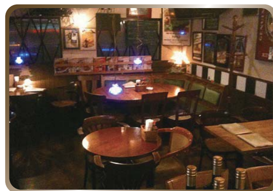
第4回ゲストのお店 アリオリオ

※ご記入いただいた個人情報は、当セミナー受付及び主催団体が行うセミナー等のご案内以外の目的には使用しません。