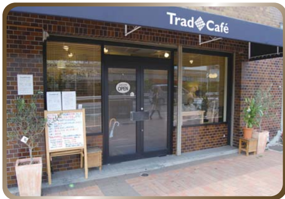
第2回ゲストのお店 トラッドカフェ

マーケティング戦略／物件選び／スタッフ採用／計数管理／開業計画書作成まで。より実践的なカリキュラムで、あなたの飲食店開業・経営を強力にバックアップ！