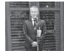
稗田兵庫県青年中央会 会長の挨拶