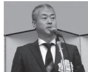
稗田兵庫県青年中央会会長による決議文朗読