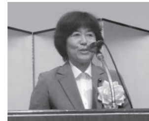
徳安兵庫県議会副議長の祝辞